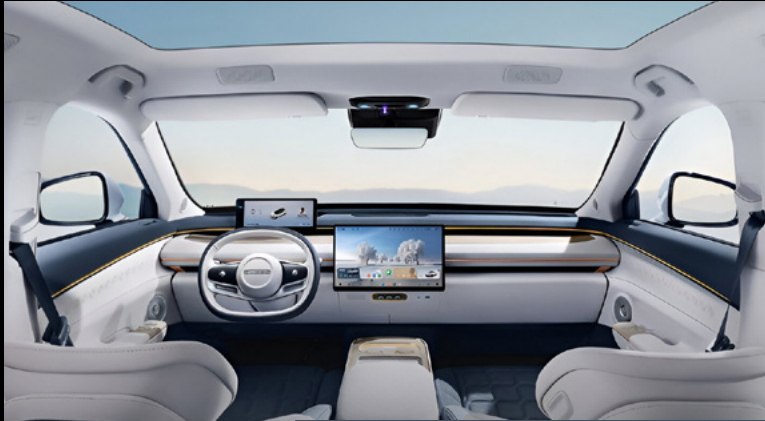
Flagship: Slate Gray