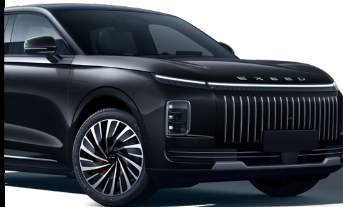
> Carbon Crystal Black