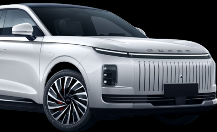
> Khaki White