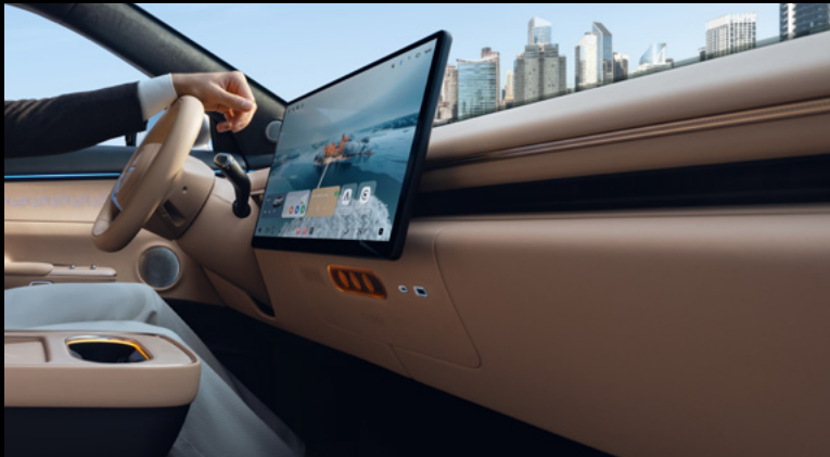
Flagship: Black Brown