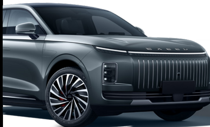
> Iridescent Silver