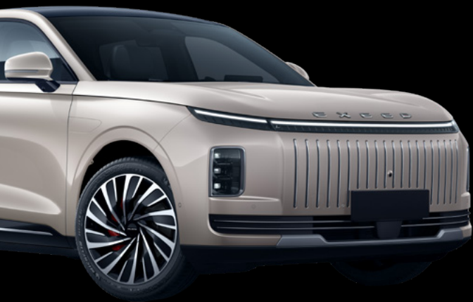
> Elegant Gray