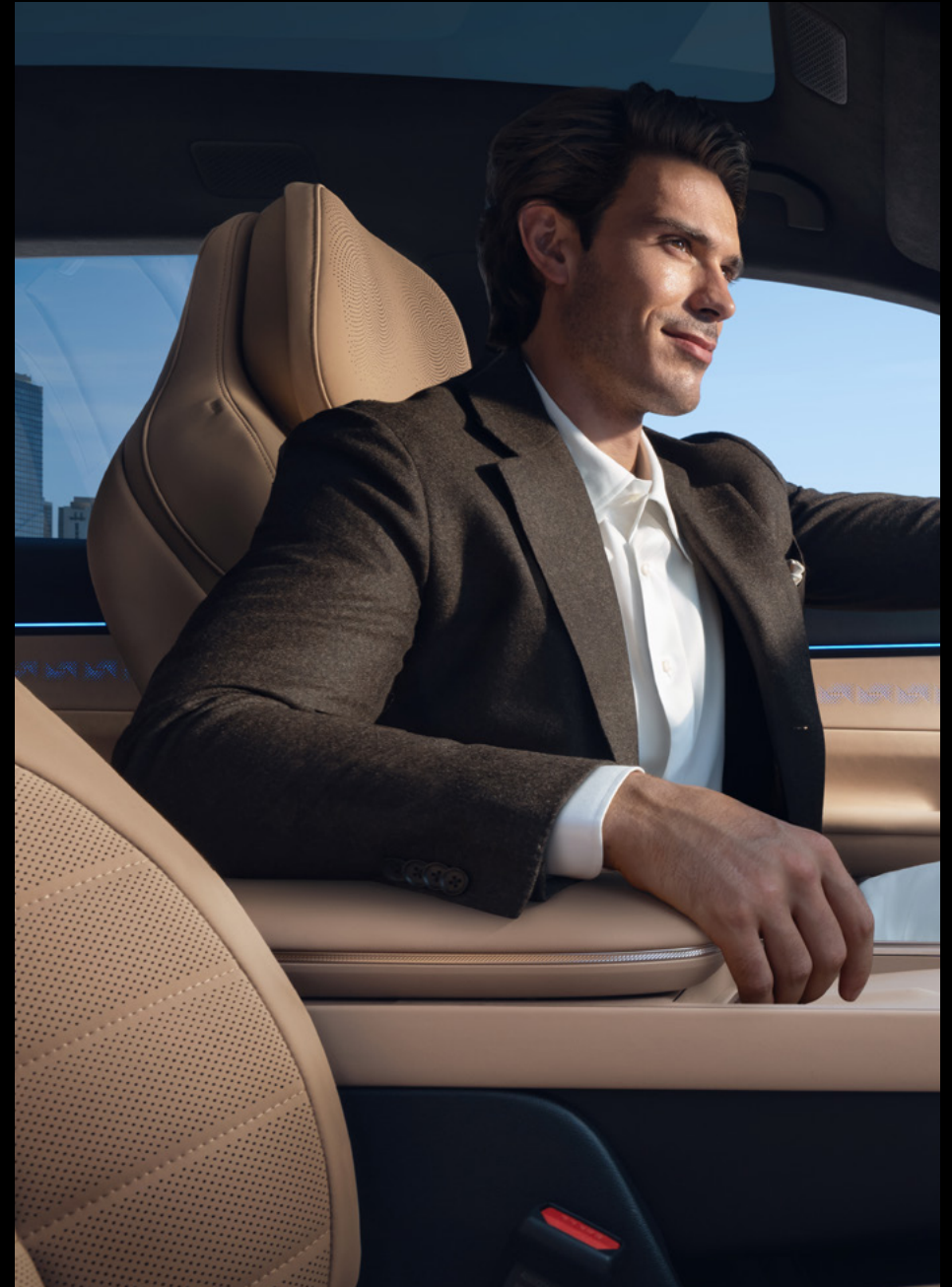
Luxury: Black Brown